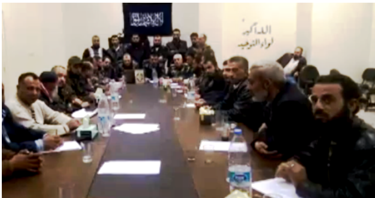
Salaficcy dżihadysty ogłaszają powstanie Państwa Islamskiego w Aleppo (2014)

Tym niemniej są intelektualnie zbliżeni do polityków. Ogólnie akceptują argumenty polityków, że puryści mają ograniczone rozumienie kontekstu. Jednak nawet w tym przypadku konflikt dotyczy strategii, a nie różnic w aqida . Dżihadysty przyznają, że puryści posiadają wiedzę na temat islamu, ale twierdzą, że są oni ignorantami jeśli chodzi o obecną sytuację, albo ukrywają przed ludźmi prawdę o kontekście.